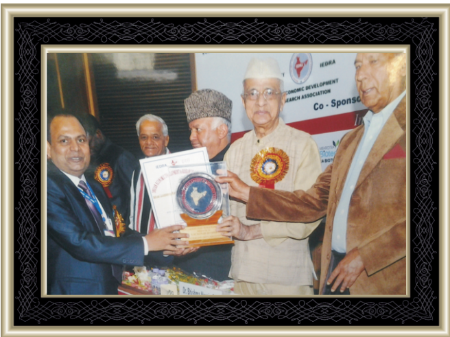
Awarded with " BHARTIYA UDYOG RATNA AWARD" in 2012