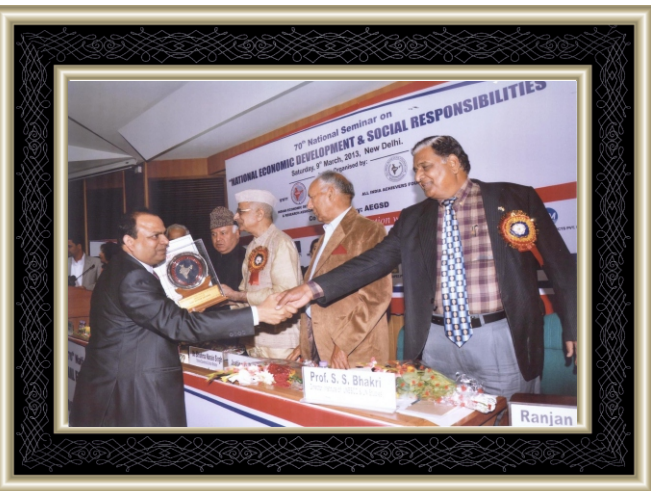
Awarded with " INDIAN LEADERSHIP AWARD FOR HEALTH CARE EXCELLENCE "