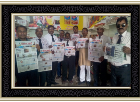
Launching of Media Division Moral Vision Prakashan- "GRAMYA WARTA"